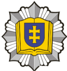
Profesinio mokymo įstaiga