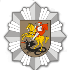
Teritoriniu principu veikiančios policijos įstaigos